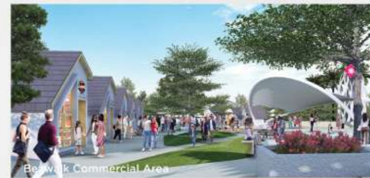
Business Commercial Area

Setelah berhasil mengembangkan Kota Gading Serpong, Paramount Land mempersembahkan sebuah kota mandiri baru di Barat Jakarta dengan luas ±400 ha dengan fasilitas yang lengkap, Paramount Petals.