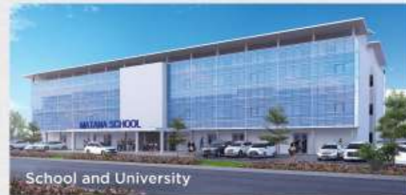
School and University